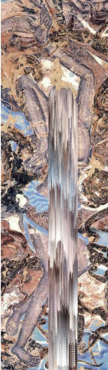
魏威 (ギイ) 「False gods and buddhas」 ミクストメディア、インクジェットプリント 2021年

GALLERY HEPTAGON HEPTAGON WORKS GALLERY and LIVING