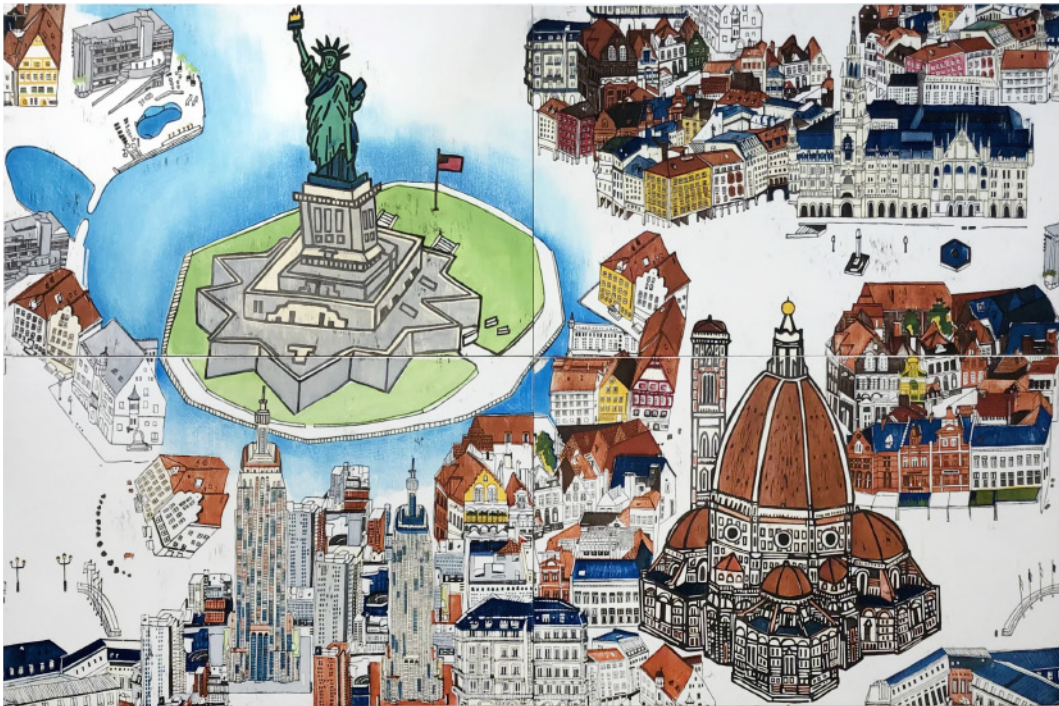
小島 花菜 「World map」 木版画 2021 年