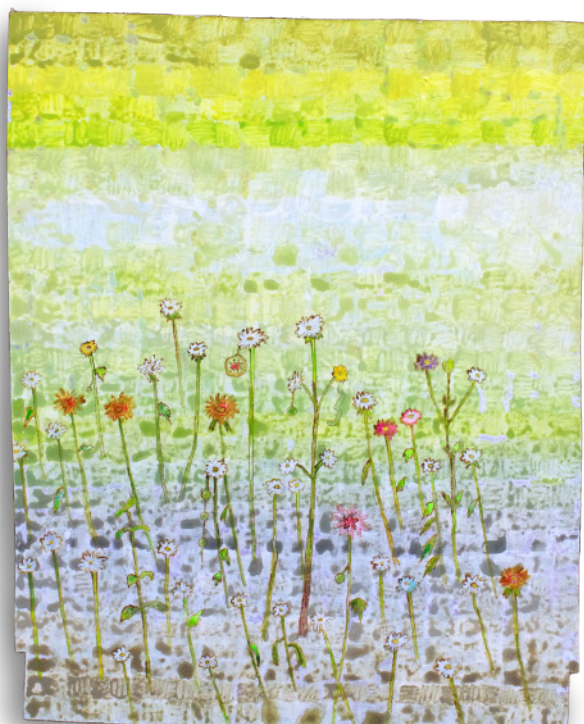
『g & p (positive)』 板にアクリル 390×480mm 2022