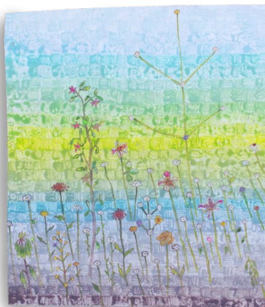
『g & p (puddle)』 板にアクリル 366×422mm 2022