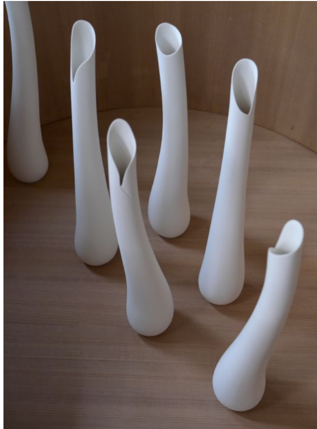
「plants | 2023」 2023 H510×D90mm 磁器／铸込