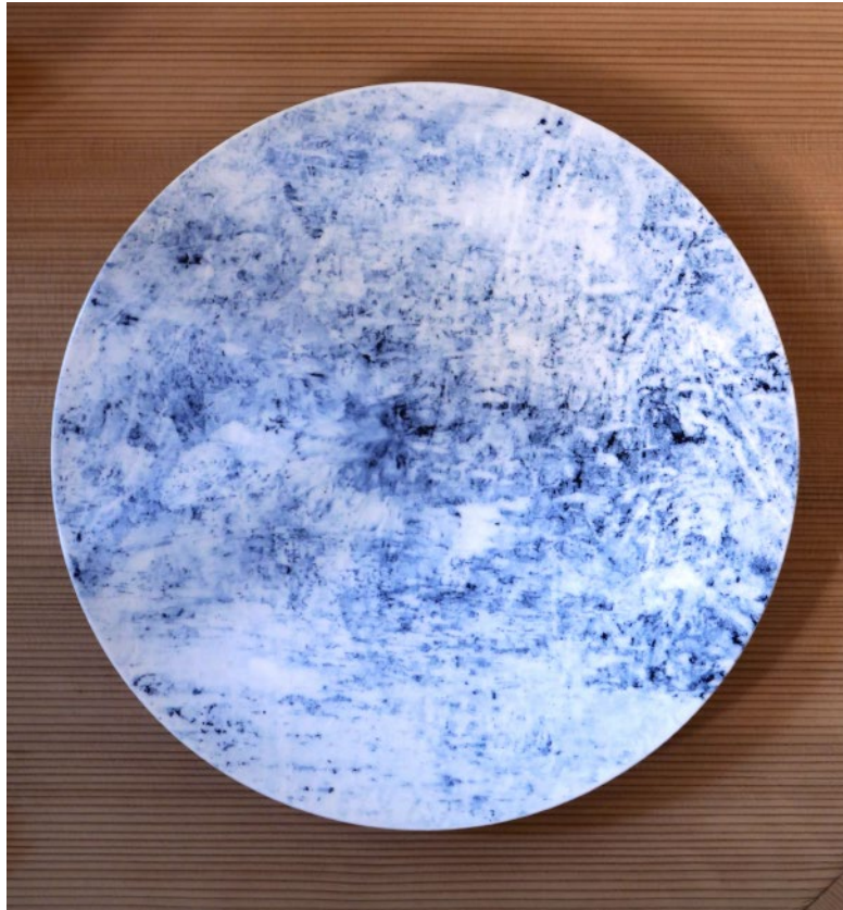
「floating surface #1」 2023 W290×D290×H35mm 磁器 / 銅版転写技法