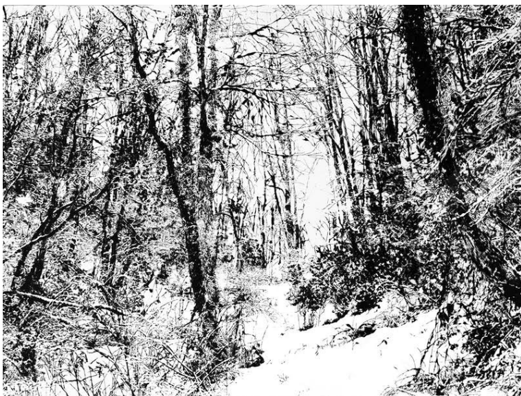
「forest #1」 2023 450×600mm ドライポイント技法