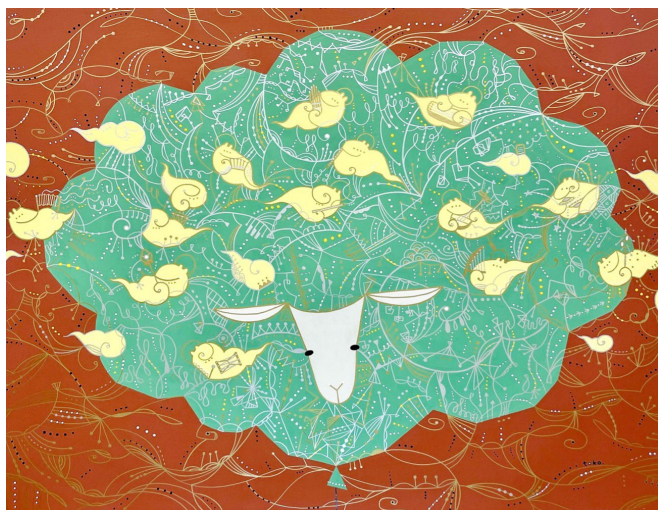
『cloudy - フェイク ニュース -』 H910 × W1167 × D26mm 支持体/木製パネル 素材/アクリル絵具、顔料 2022