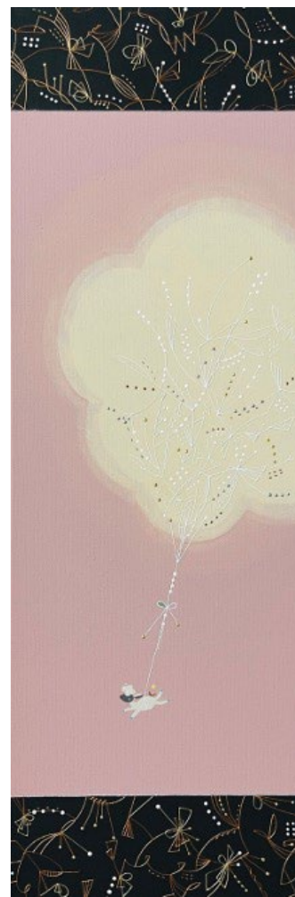
『もくもくをかてに - brave little thing / black -』 H600 × W200 × D38mm 支持体/キャンバス 素材/アクリル絵具、顔料 2023