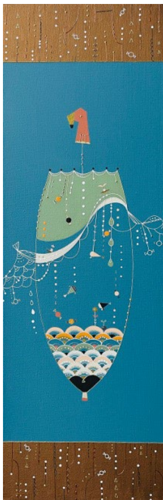
『アメの日傘 - upside down umbrella / sky -』 H600 × W200 × D38mm 支持体/キャンバス 素材/アクリル絵具、顔料 2024