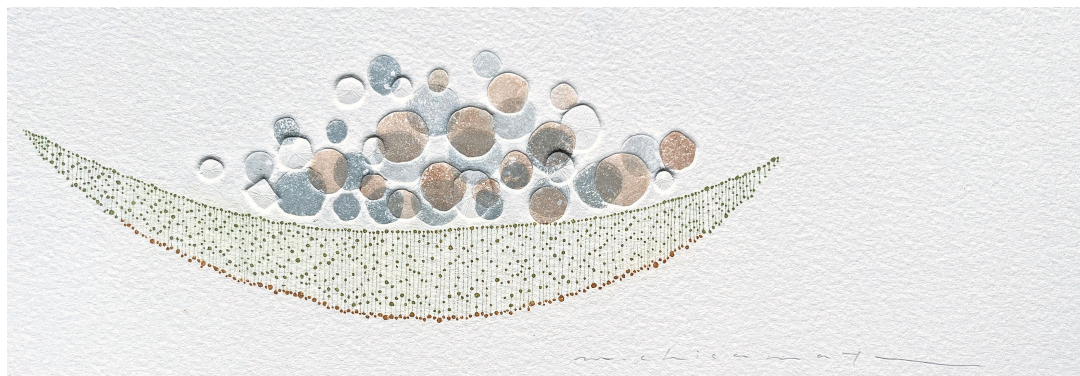
《ひとつの在ること》 エッチング、アクアチント、エンボッシング モノプリント 100×300mm 2025